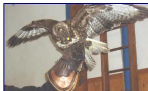
Dravce v škole