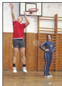
Zápal z hry bol sympatický