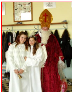
Sv. Mikuláš a anjeli v škole