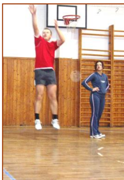
Pán riaditeľ v „ akcii“