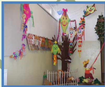
šarkana dostali tiež.

Máme radi nielen svojich rodičov, ale aj starkých a ako poďakovanie sme im pripravili program v kultúrnom dome ku