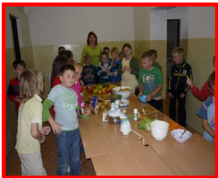
Kolektív 2. A, 2. B